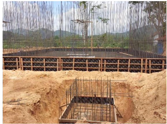
งานติดตั้งระบบท่อส่งน้ำและอาคารประกอบ ความยาว ๗๓๔ เมตร พร้อมก่อสร้างถังเก็บน้ำ ขนาดความจุ ๔๕๐ ลูกบาศก์เมตร