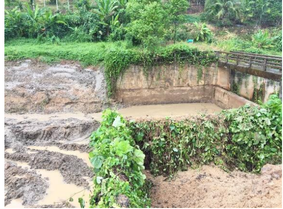
งานขุดลอกฝายบ้านสันเจริญ