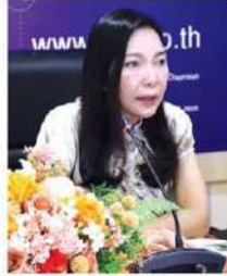
เศรษฐกิจฟื้นตัวช้า