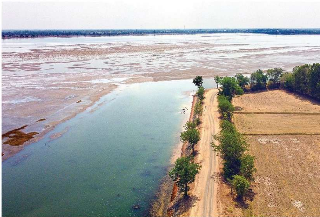
วิกฤต - ภาพมุมสูงอ่างเก็บน้ำบึงกระโดน แหล่งเก็บกักน้ำขนาดกลาง ปัจจุบันมีปริมาณน้ำเก็บกักเหลือเพียง 2.62 ล้าน ลบ.ม. ถือว่าเข้าขั้นวิกฤตอาจไม่เพียงพอใช้ผลิตน้ำประปาให้ชาวบ้านใช้อุปโภคบริโภค ที่ อ.ประทาย จ.นครราชสีมา เมื่อวันที่ 29 กุมภาพันธ์

ผู้สื่อข่าวรายงานว่า สถานการณ์ฝุ่น PM2.5 พื้นที่รับผิดชอบของสำนักงานสิ่งแวดล้อมและควบคุมมลพิษที่ 1 (เชียงใหม่ เชียงราย ลำพูน แม่ฮ่องสอน) พบค่า PM2.5 ระหว่าง 37.4-62.0 มคก./ลบ.ม. คุณภาพอากาศอยู่ในระดับปานกลางถึงเริ่มมีผลกระทบต่อสุขภาพ โดยพื้นที่ที่ค่าฝุ่น PM2.5 เกินค่ามาตรฐาน คุณภาพ