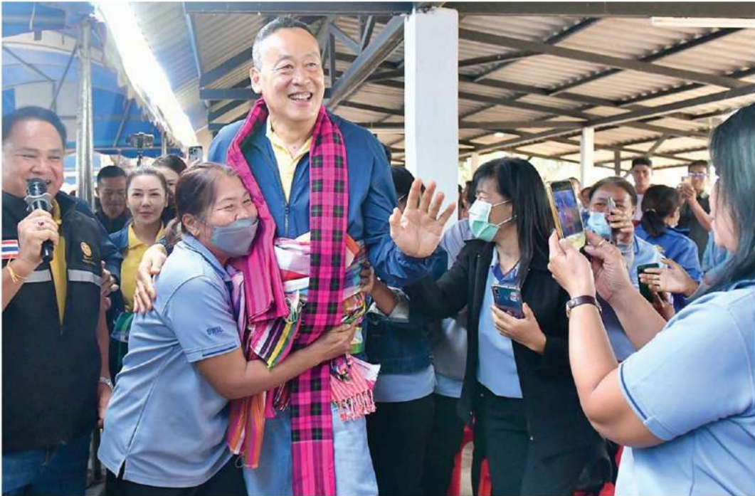
🏠 वादโลก - นายเศรษฐา ทวีสิน นายกรัฐมนตรี และรมว.คลัง คล้องผ้าขาวม้าสีดงใส่ที่ชาวบ้านมอบให้ ขณะไปตรวจโครงการส่งน้ำและบำรุงรักษาชลประทาน จ.ร้อยเอ็ด ระบุว่าใช้ผ้าขาวม้าสีดงคล้องร่วมกับชุดสูทสีน้ำเงิน ระหว่างเยือนฝรั่งเศส เร็วกว่านี้

อะไรบ้าง เพื่อจะจัดสรรงบประมาณในพื้นที่ ปีที่ผ่านมาการบริหารจัดการน้ำถือว่าจัดการได้ดี ไม่ท่วมไม่แล้ง เกษตรกรทำนาได้ ส่วนปีนี้ก็น่าจะโอเค อย่างไรก็ตามเรายังต้องพึ่งธรรมชาติ ซึ่งตนได้กำชับกับอธิบดีกรมชลประทานแล้วว่าเรื่องการใส่ใจบริหารจัดการปริมาณน้ำที่เหมาะสมให้กับเกษตรกรได้มีน้ำใช้เพาะปลูกพอประมาณ ถือเป็นเรื่องสำคัญ