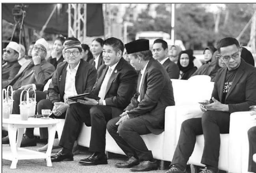
งานฮาลาล : ร.อ.ธรรมนัส พรหมเผ่า รว.เกษตรและสหกรณ์ เปิดงาน Bangkok Halal 2024 (งานบางกอกฮาลาล 2024) ครั้งที่ 10 ภายใต้แนวคิด Transform Life ที่สนามกีฬาหัวหมาก การกีฬาแห่งประเทศไทย เพื่อนำเสนอหลักการอิสลาม เรื่องฮาลาลันนุอยยิบัน ส่งเสริมสินค้าฮาลาล และการให้บริการต่าง ๆ

ทั้งนี้ ภายในงานเปิดโอกาสให้ผู้ประกอบการฮาลาลมาจำหน่ายสินค้าและบริการฮาลาล ในปีนี้ได้ให้ความสำคัญกับการเปลี่ยนสู่ชีวิตที่ดีกว่า ภายใต้แนวคิด "Transform Life" นอกจากนี้ยังมีการแสดงและจำหน่ายสินค้าไม่น้อยกว่า 200 ร้านค้า ประกอบด้วยสินค้าหลากหลายประเภท เช่น อาหารปรุงสด อาหารเครื่องดื่ม เครื่องแต่งกาย เครื่องสำอาง ธุรกิจบริการ เป็นอีกช่องทางในการกระตุ้นเศรษฐกิจให้ดียิ่งขึ้น