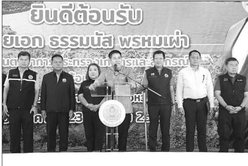
ช่วยเหลือ : ร.อ.ธรรมนัส พรหมเผ่า รมว.เกษตรและสหกรณ์ ลงพื้นที่รับฟังปัญหาของเกษตรกร ที่ อบต.กะเปอร์ จ.ระนอง พร้อมเร่งช่วยเหลือแก้ไขปัญหาการขาดแคลนน้ำอุปโภค-บริโภค การวางแผนก่อสร้างอ่างเก็บน้ำคลองเคียนงาม สำหรับเป็นแหล่งน้ำสำรองในพื้นที่ ต.บางหิน ต.ม่วงกลาง และ ต.กะเปอร์