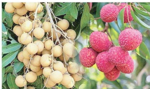
แล้วร้อยละ 10.35

แต่จะมีผลผลิตประมาณ 1.047 ล้านตัน เพิ่มขึ้นจากปี 2566 ร้อยละ 10.24 แบ่งเป็นลำไยในฤดู 0.702 ล้านตัน เพิ่มขึ้นร้อยละ