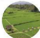
ส่งเสริมท่องเที่ยวเชิงเกษตร