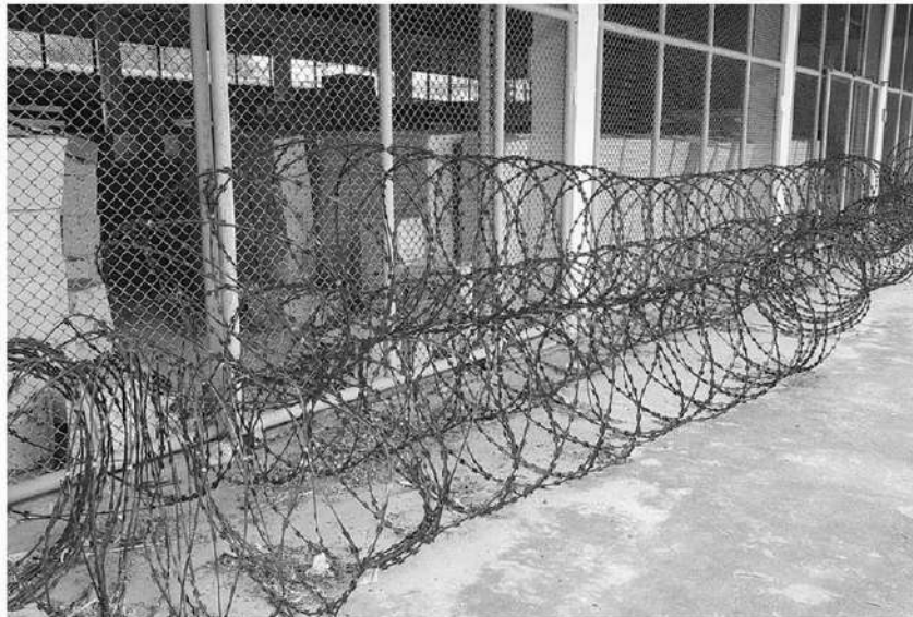
เจอทางออก - สารบีบีของกลางที่ถูกทิ้งร้างนาน 12 ปี ในหอประชุมอำเภอเมือง-วัดนาหูกวาง อ.ทับสะแก จ.ประจวบคีรีขันธ์ หลังชาวบ้านหว่นวิตกได้รับสารพิษ ล่าสุดพบทางออกแล้วเมื่อ ร.อ.ธรรมนัส พรหมเผ่า รมว.เกษตรและสหกรณ์ สั่งด่วนเร่งกำจัด ภายใน 1 สัปดาห์

สำหรับปัญหาเรื่องสารบีบี เกิดขึ้นหลังจากเมื่อปีงบประมาณ 2555 มีการประกาศเขตภัยพิบัติฉุกเฉินเพื่อจัดซื้อสารบีบี ใช้กำจัดแมลงกำหนดเป็นจำนวนมาก โดยจังหวัดใช้เงินอุดหนุนจากราชการประกาศเขตภัยพิบัติฉุกเฉินของกรมป้องกันและบรรเทาสาธารณภัย (ปภ.) จัดซื้อสารบีบี และสารเคมีชนิดอื่น เพื่อแจกจ่ายให้เกษตรกร แต่กรมวิชาการเกษตรมีหนังสือแจ้งว่า บริษัทผู้สัญญาำาสินค้าที่ไม่ได้รับการขึ้นทะเบียนวัตถุอันตรายทางการเกษตรจึงไม่สามารถนำมาจำหน่ายกับทางราชการได้ จังหวัดจึงแจ้งให้บริษัทผู้สัญญาเคลื่อนย้ายสารบีบีที่ออกจากสถานที่ของทางราชการ และจะดำเนินการตามข้อกฎหมาย แต่ผ่านมา 12 ปีไม่มีการดำเนินการเคลื่อนย้าย บรรจุภัณฑ์บางส่วนเริ่มฉีกขาดรั่วไหลส่งกลิ่นเหม็นตามกระแสลมเป็นมลพิษทางกลิ่น