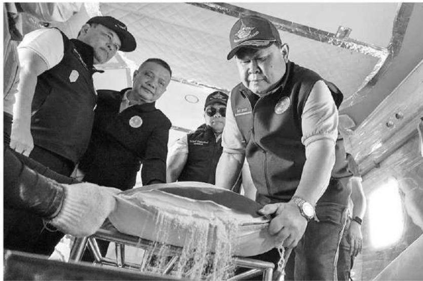
ทำฝนหลวง - นายไชยา พรหมา รมช.เกษตรและสหกรณ์ ขึ้นเครื่องบินฝนหลวง พร้อมกับเจ้าหน้าที่ เพื่อโปรยสารเคมีในอากาศสร้างเม็ดฝนบรรเทาปัญหาหมอกควันและฝุ่น PM2.5 ในพื้นที่จังหวัดเชียงใหม่ เมื่อวันที่ 11 เมษายน