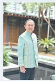
'หอการค้า' มองปี 67 ศก.ฟื้นตัวช้า จีรัฐอัดมาตรการกระตุ้น - แก้หนี้ - ลดค่าไฟ >6