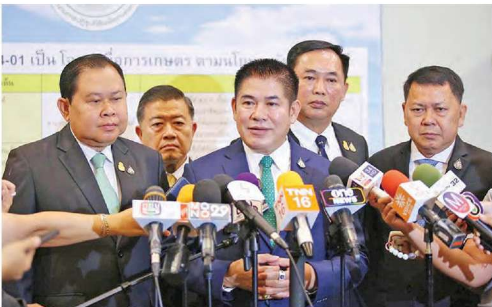
ร.อ.ธรรมนัส พรหมเผ่า รมว.เกษตรและสหกรณ์